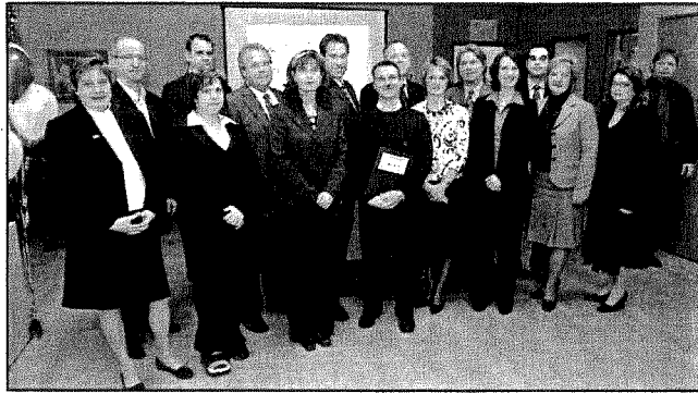
Situé à l'intersection du boulevard du Curé-Labelle et de la rue Charles, dans le secteur Saint-Janvier, le Carrefour des affaires de Mirabel abrite neuf locataires.

entre autres, la Chambre de commerce et d'industrie de Mirabel, le Carrefour jeunesse-emploi de Mirabel et le député de Mirabel, François Desrochers. «Le bureau de la circonscription de Mirabel est en fonction et ouvert aux citoyens depuis plusieurs mois déjà. Aujourd'hui, je suis fier de le présenter officiellement à mes concitoyens afin que le plus grand nombre de gens possible puisse bénéficier des services offerts par mon équipe et moi-même», a déclaré ce dernier.